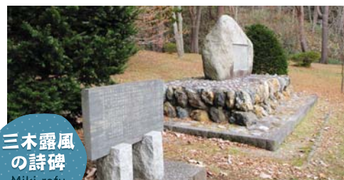
三木露風の詩碑 Miki roku